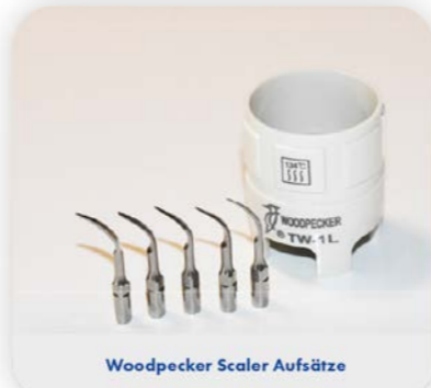
Woodpecker Scaler Aufsätze