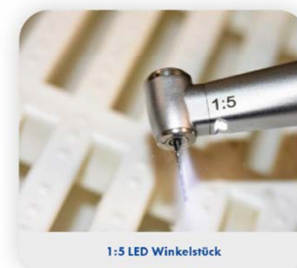
1:5 LED Winkelstück