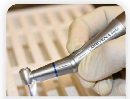
1:1 LED Winkelstück