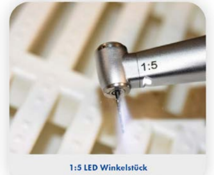
1:5 LED Winkelstück