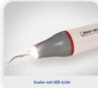
Scaler mit LED-Licht