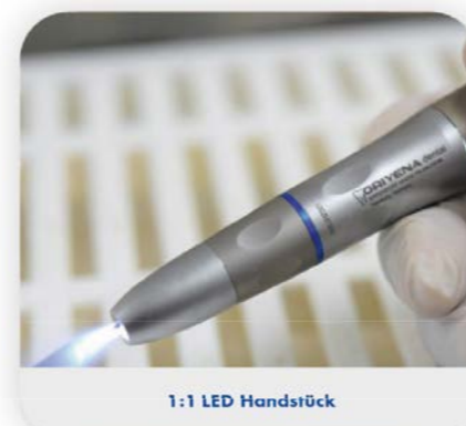
1:1 LED Handstück