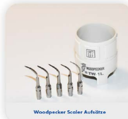
Woodpecker Scaler Aufsätze