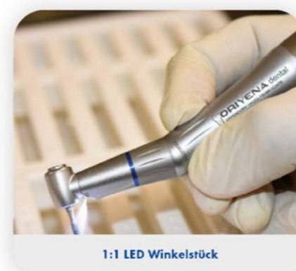
1:1 LED Winkelstück