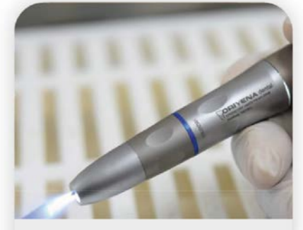
1:1 LED Handstück

Wahl zwischen zwei LED-Behandlungslampen: kleine Lampe mit 6 LEDs und 20.000-42.100 Lux oder große Lampe mit 28 LEDs und 140.000 Lux, beide mit Infrarot-Sensor für gelbes Licht