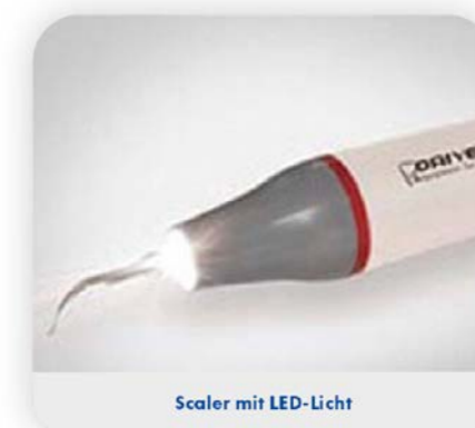
Scaler mit LED-Licht